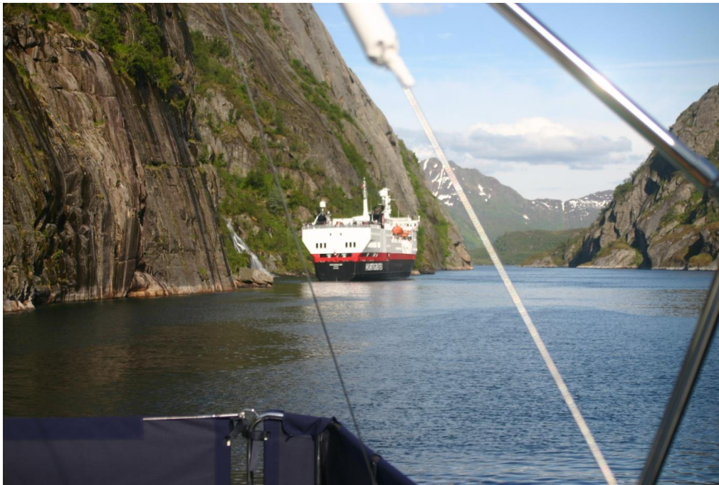
Trollfjorden i sällskap med Hurtigtuten