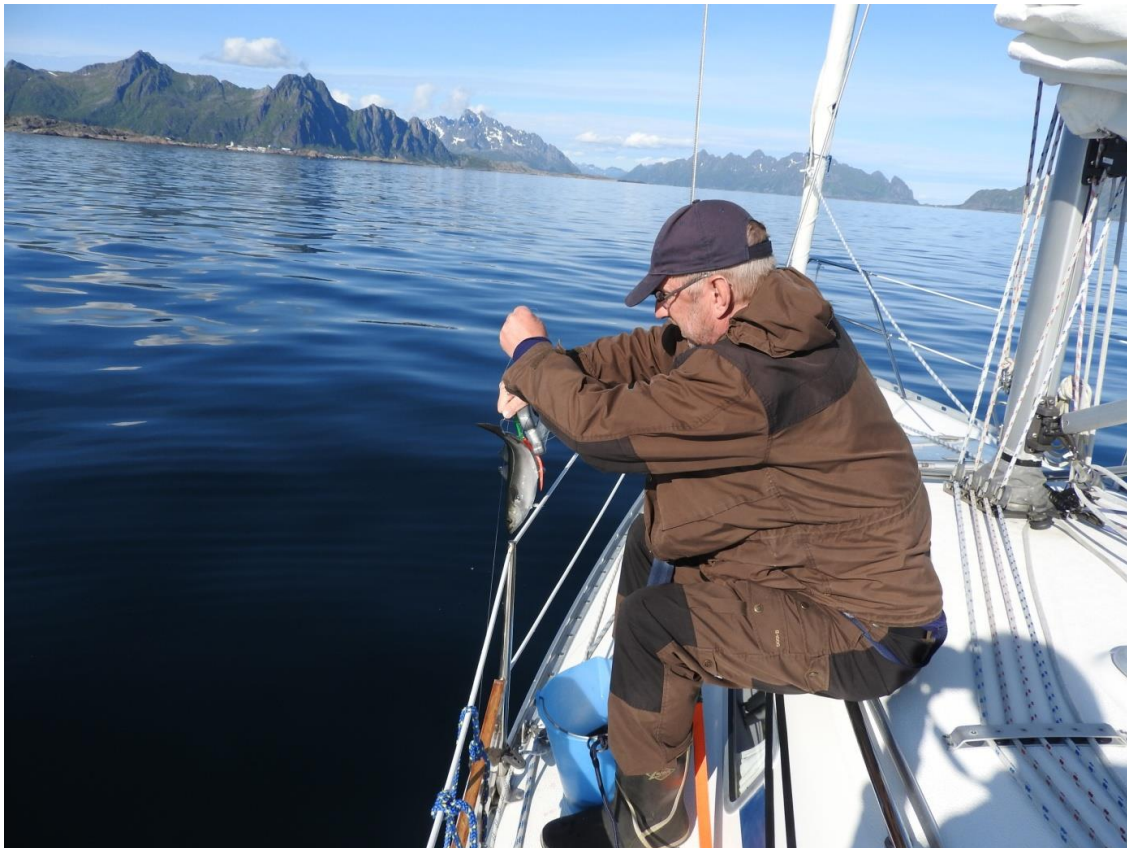
150706 Stannar idag i hamn och har en skön dag med god mat