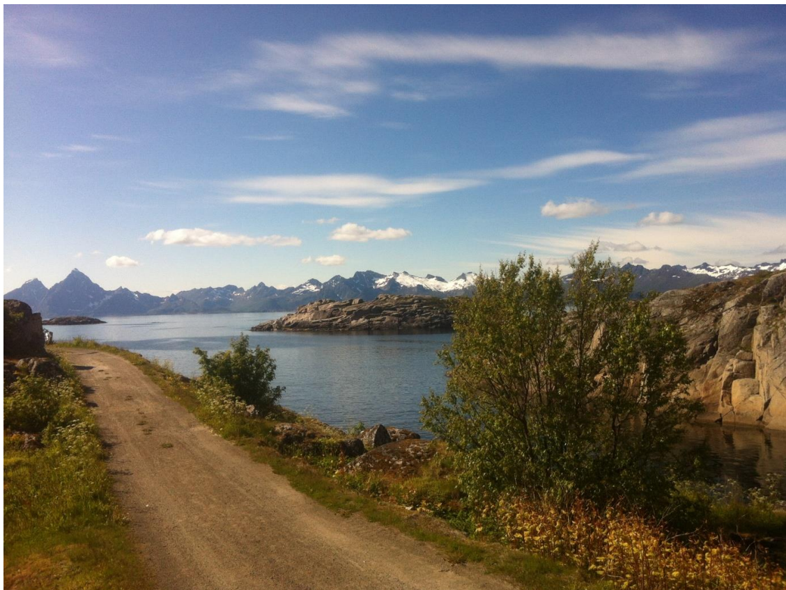
Lofoten sett från kärleksstigen på Skrova